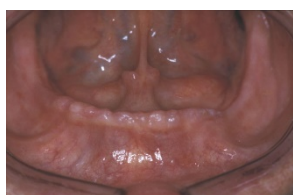
Analyse endo buccale