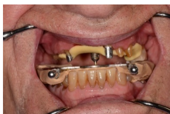
Enregistrement par pointeau central

Pour cela, j'utilise un appareil (pantographe) qui permet de calculer vos différents mouvements et de pouvoir les reproduire sur un simulateur