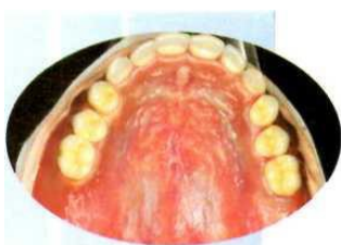
Finition cire polychromique